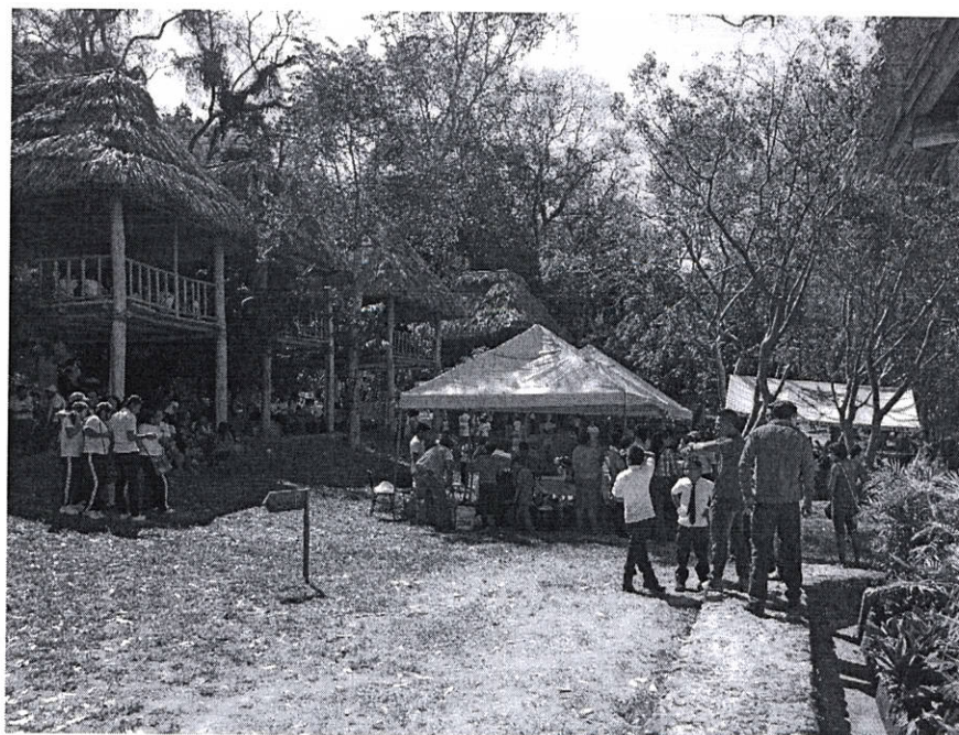
Fig.2: Celebración día del agua.

Se celebró el día internacional del agua junto a escolares de las escuelas primaria aledañas al Parque, durante esta celebración hubo diversas actividades con el fin de sensibilizar a los niños sobre el agua y la conservación.