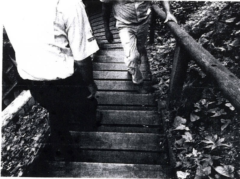
Fig.8: Verificación del estado de la infraestructura de uso público.

Previo a semana santa y la celebración del día internacional del agua, se observó el estado de la infraestructura de uso público con el fin de identificar las necesidades de mantenimiento, se prioriza la atención de fallas y desperfectos que puedan poner en riesgo la integridad de los visitantes.