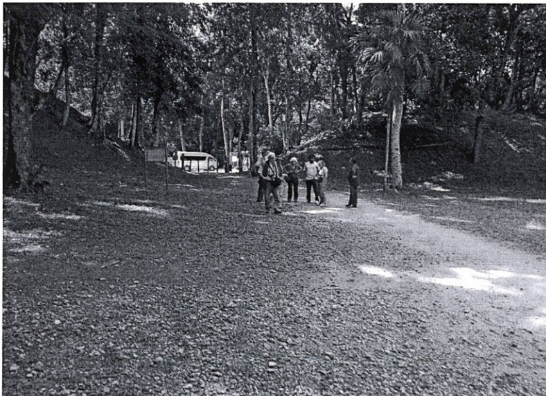
Fig.6: Actividades de visita en zona de uso público sitio Yaxha.

Para observar el trabajo que realiza el grupo de vigilancia en los diversos puestos dentro de la zona de uso público, atención de visitantes, cumplimiento de la normativa, limpieza e implementación de registros en las áreas de ingreso.